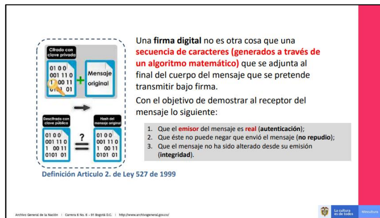
IMAGEN 2. CARACTERÍSTICAS DE LA FIRMA DIGITAL